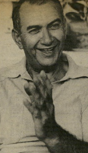
ראש-העירייה ניצן הפתעות, הפתעות

מצא עצמו ראש-העירייה החדש מכטיב כספים לספורט, למרות שמקורביו הודו שקופת העירייה ריקה מכסף. אך יעמוד ראש-העירייה בהבטחתו רק לו פיתרון, אבל הוא איש רכה-הפתעות, כשיצא מחדר-ההלבשה של שחקני עירו הפתיע את כל הנוכחים, כשמידר לשחקני הקבוצה היריבה, ללחוץ יריהם, לברכם ולעודדם על המישחק היפה שהפגינו באותו היום, למרות ההפסד.