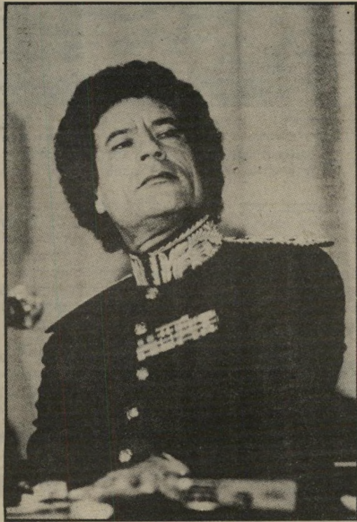
שליט לוב קדאפי ירידה דראסטית ביבוא המזון

בארצו. לארגנטינה יש יכולת גרעינית ניכרת, המדיאגה את שכנתה, בראזיל, אבל כל המשקפים צופים קיפאון מוחלט בשטח זה, כולל עיכוב בהפקת פצצה גרעינית בעשור הקרוב. אלפונסין מודאג מאוד מתגובה אפשרית של צבא, הידוע בנטייתו האנטי-דמוקרטיות, לכל חיתוך מוהק בכשר החי של הביטחון, אבל האילוצים הכלכליים הם כה כבדים, עד שלא נותרה לו כל ברירה אחרת.