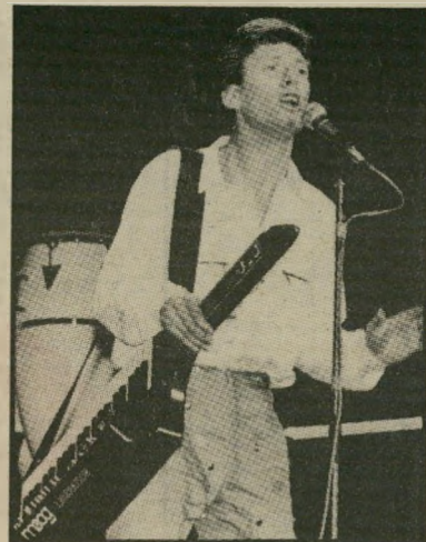
מוסיקאי רוק וינווד בכליון עיניים ואוונטיים

● מוסיקאי הרוק הוותיק טיב וינווד (קשתו של צוללן), סיים סיבוב הופעות באירופה ועובר במרץ על תקליטו הבא. בהופעות אלה ליוו אותו נגנים מצויינים וארצות-הברית כבר מצפה בכיליון עיניים ואוונטיים להופעותיו המתוכננות שם. וינווד שמר תמיד על רמה גבוהה בהרכבים אשר נטל בהם חלק, דוגמת להקת ספנסר דייוויס וטר אפיק. בשנים האחרונות הקדיש זמן