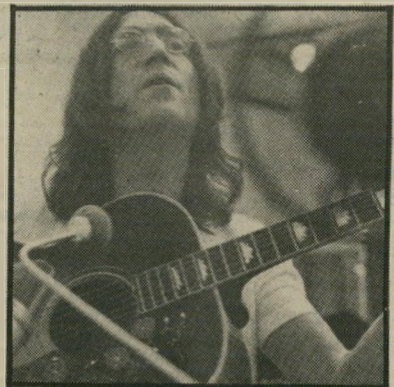
חיפושית לנון אנו חיים על זמן שאול

בניגום נמצא את צועד החוצה, אני לא רוצה לעמוד בפני זה וזמן שאול.