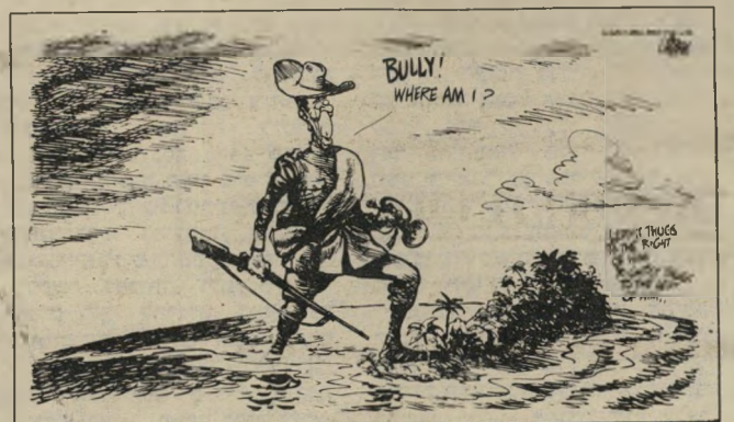
"היכן אני, לכל הרוחות!" (קאריקטורה של אוליפאנט)

לא חוסלו כוחות אש"ף, צה"ל הגיע למבואות ביירות באיחור רב, ולבסוף נסוגו כוחות אש"ף מכיירות בסדר ובכבוד. עוד בתי־קבורה יתה יש שוב אסכולה הסבורה כי כראי לישראל להנחית מכה על