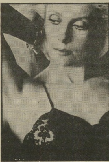
קאתרין דנב האידאל הנשי

הסרטים שעשה באותם הימים הוא מעדיף לא לזכור, אם כי הוא מוסיף על הגייה, כאשר אפשר היה לקרוא רק את תקציר העלילה ואת שם הבימאי, הם נראו היכה יותר טוב מאשר על המסך. אחד כך הגיעו השנים שולאחר מילחמת ויאט-נאם, כאשר רוד צעיר וזועם של בימאים אמריקאים חיפשו שחקנים בעלי חזות שונה, בעלי השתייכות עדתית ברורה יותר, שחקנים מחוספסים ונוקשים יותר משריף, וכך הוא מצא את עצמו, בהדרגה, מחוץ למיקצוע, עסוק בעיסקי הבטלה שלו. למען האמת, הוא מוסיף, לא נאבק במיוחד בתהליך זה, אולי משום שלא היה רגיל לכך. כל מה שהיה בידיו לפני כן, הגיע אליו בקלות רבה, תחל ממעמד של אליל-קולנוע במצריים, ועד לתפקידים כמו ר"ד זיוואנו. כאשר צריך היה להשקיע מאמץ כדי לשמור על ההישגים, הוא העדיף לנח על זרי הדפנה. ביום בהיר אחד, לדבריו, החליט לברוק אם ככלל נשאר בו ניצוץ והתלהבות, שהיה בו פעם. הוא לחש בכמה אונייים מקורבות כי היה רוצה לחזור לבימה, ומכאן התפקיד ומחזהו של טרנס ראטיגן, שזיכו אותו בביקורות מעוררות. קלפים וסוסים אינם מעניינים אותי עוד, הוא מכריז עכשיו. אני חש צעיר יותר, אני רוצה להפוך את הדף. זכרונות מעולם הסרטים לא נשכחו, ככל זאת. אופיע בסרט רק אם מרובר בעבודה קצרה ובכסף רב, הוא מצהיר. לעומת זאת הוא פתוח לכל הצעה מן התיאטרון, ובמיוחד הוא משתוקק לגלם את אתולו, "זו תהיה הפעם הראשונה שמאורי (ערבי מצפון-אפריקה) יגלם את התפקיד שכתב למעשה על מאורי."