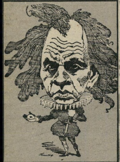
אנטי-פסיכולוג לאינג שפיות, טירוף ומישפחה

אלא שבדומה לכל פרובינציה, גם החבר הישראלית, למעט רופאים בודדים, לא קלט ולא היתה מוכנה לקלוט את התורה החדשנית, א