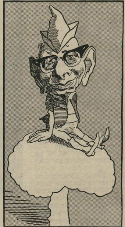
פסיכולוג בטלהיים אדום מיני

גילהתהבגרות שעדיין אינה נכונה לקראתן מבחינה נפשית. מכיוון שעדיין לא השתלטה על מאבקה האידסאליים... הזאב אינו רק הגבר המסתה; הוא אף מסמל את כל הנטיות הבלתי-הברתיות והחיותיות שבתוכנו... לכל אורך הסיפור, הן בשמו והן בשם הילדה, מושם דגש על הצבע האדום, שהיא לובשת בגלוי. הצבע האדום מסמל רגשות סוערים, לרבות רגשות מיניים... כיסה אוזניה מדברת על תאוות אנושיות, על להיטות אוראליות, על