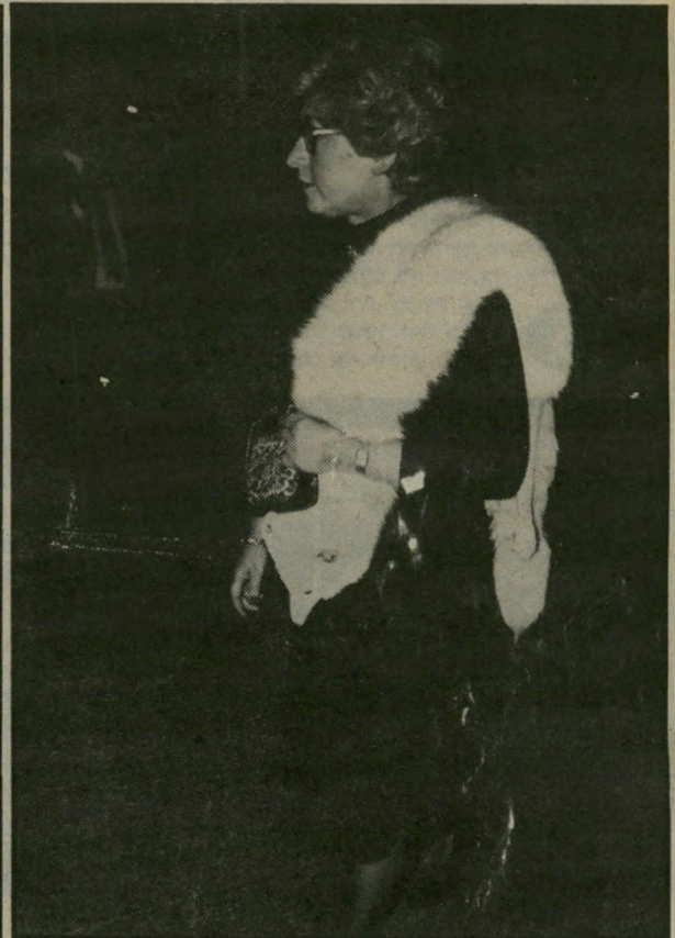
שועל לבן בדרך לחתונת שפירא

אחרת. כך יכול גם אדם החי בחברה הישראלית אי-אפשר להיות מוסלמי מכוח הישיבה בין מוסלמים, ללא התהליך והטקס הדתי והסכמת מוסמך העדה הדתית. אי-אפשר להפוך נוצרי