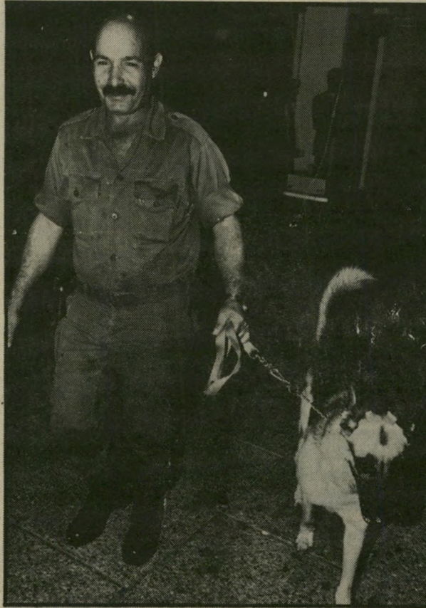
כלב רועים גרמני בא לשמור על אורחי הח"כ ניקיון-שניים וחוסר לחם...

מיכתבי קוראים מתפרסמים בקיצורים המתחייבים מתוכנם ומשיקולי מקום. עדיפות תינתן למיכתבים קצרים, מודפסים במבטת-בחיבה, שצורפה אליהם תמונת הכתב. מיכתבים בעילום-שם לא יפורסמו. אין המערכת מחזירה את המיכתבים שנתקבלו בה.