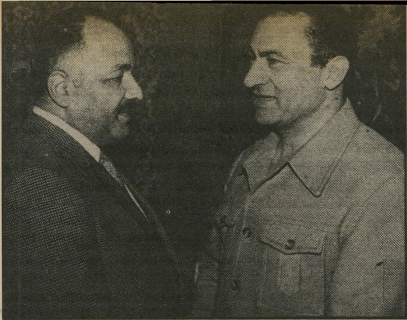
מובארב וסגן ראש ממשלת עיראק, רמאן טילים מצרפת. תצלומים מאמריקה וטנקים מרומניה

מסתפק בתפקידו כשליט אבו-דאבי, השוכנת לחוף המפרץ הערבי (המפרץ הפרסי). הוא גם מקדיש שעות רבות ביום לחווות. כי הוא רוצה חקלאות וירק במידבר. כך יכולים תושבי הבירה לזכות בשתילים חינם וברשן מסובסד מהעירייה, וכך יכול כל מגרל חיטה להיות בטוח שממשלת השייח' תרכוש ממנו כל גרעין חיטה במחיר הגבוה פי חמש ממחירו הבינלאומי (600 דולר הטונה, תחת 120 דולר).