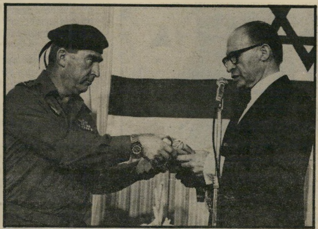
בגין מעביר לרפול את דגל הרמטכיל

קריאה זו מוציאה גבריאלה ר'אנוני צ'ימי המילחמה (מילחמת-העולם הראשונה). בשום לשון ובשום בת לשון אין שמך זכר לניב זה. המציאה לא הכניס בו שום תוכן נכון, אבל דווקא משום-כך נתברכה הקריאה הזו בכל הסגולות, המכשירות אותה להיות אחת הנוסחות הקדושות של הליטורגיה הפאשיסטית.