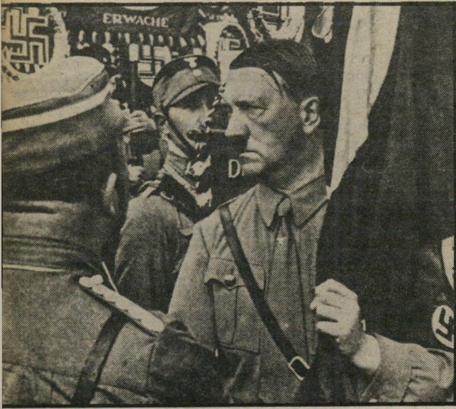
היטלר, מקדש דגל נאצי

הם פשוטי הצלילים שבלשון, שגם תינוקות יגנו אותם על נקלה, והמתמלטים שלא-מדעת גם מפי מבוגרים בתקופה אותם פחד, צער, צמרמורת. "אלאלא", "אלאלא", "Heil" הם נוסחי היתורגיה, הפותחים ומסיימים כל גילוי-דעת פאשיסטי; הם המשוים הדרת-קדושה