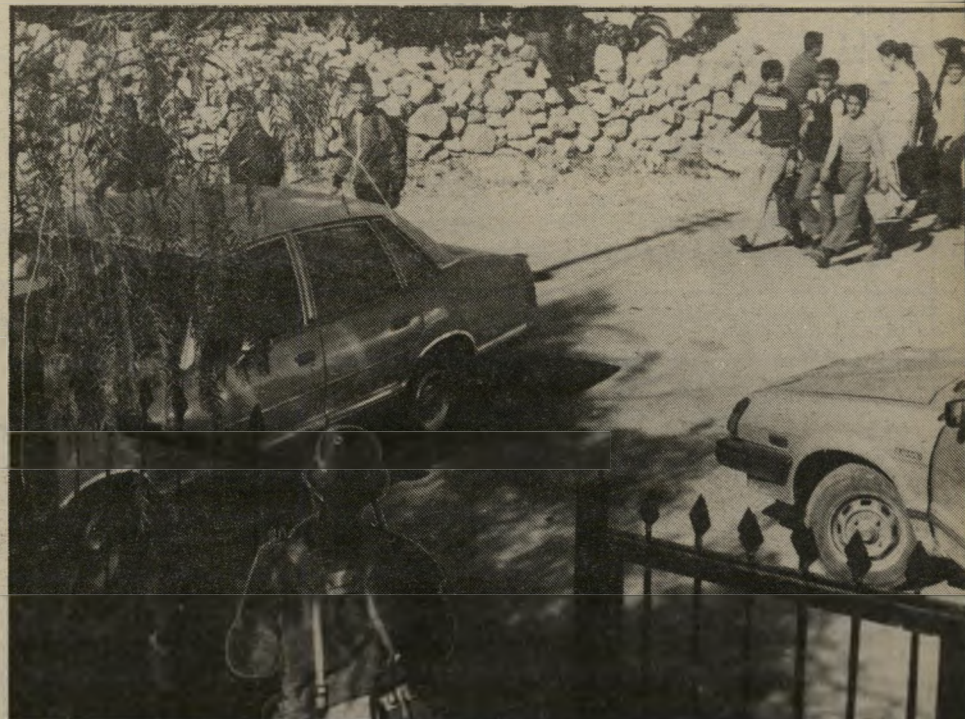
ילדים, מכוניות וחילים מבט מן הגג של קברי-יוסף: בתחתית התמונה חייל צה"ל בחגור מלא עומד בפתח. לפניו, ברחוב, מכוניות המתנחלים, שהן אונייטק הפוטנציאלי והסיבה לזריקת האבנים. מאחוריהם, ברחוב, קבוצת ילדים ערביים שסיימו את ימודיהם בבית-הספר ועוברים ליד קברי-יוסף בדרך הביתה. הילדים הם מידי האבנים על מכוניות.

המונית בקרב כל הגברים של העיר, ובניהם שכם המאוהב. וכך, חשב שכם, יוכל לשאת לאשה את דינה אהובתו. אך לא כך היה. גברי העיר עוד לא הספיקו להירפא מן הניתוח המכאיב,