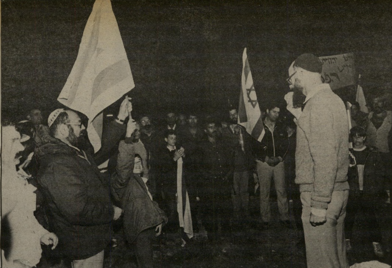
לעבר השוק הסיטונאי הסגור. המתנחלים, רובם נושאי נשק, נשאו דגלי-ישראל וכרזות שבהן היו ציטוטים מן התנ"ך על זכותם האלוהית על העיר שכם. כוחות גדולים של צבא איבטחו את ההפגנה.

יעקב הסכים את הדברים לחמור כי שכם, ואמר לו שאם הם, הגויים, ייהמקום, יסכימו לנהוג כמינהג עברים ולעשות ברית-מילה לכל זכר,