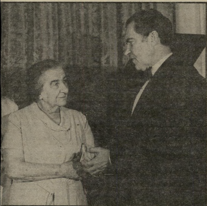
ניכסון וגולדה הכנה למלחמה

בשנה שלאחר מכן קפץ סכום יועי בבת-אחת, והגיע ל' 86.4 יוניו דולארים. זה היה הביטוי חשי להחלטה שנפלה אז בצמרת א"י ובממשלת-ישראל, להזדהות ל"יכל עם המערב במאבק הבינוני-ש, תחיל להתפתח אחרי מילחמת זלם השנייה. לא היה זה פישוט לקבל ההחלטה הזאת. בכנסת נשאו יי-כנסת מן הציונים הכלליים,