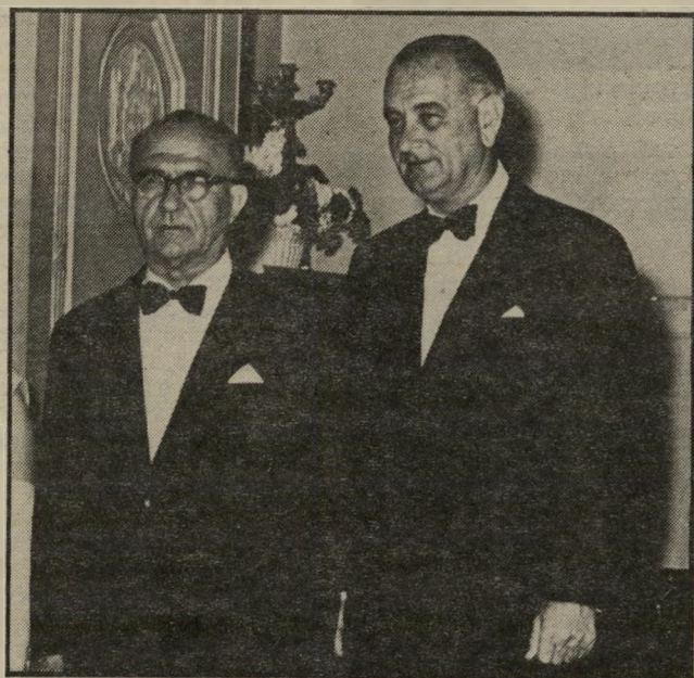
ג'ונסון ואשכול משפל לשיא

השנה הגורלית הבאה ביחסי ארצות-הברית וישראל היא שנת 1979, והצמד הפעם מורכב מראש ממשלת ישראל מנחם בגין ומהנשיא האמריקאי ג'ימי קרטר. המיפגש בין השניים האלה היה חשוב לא רק מבחינת