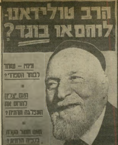
העולם הזה 1105 תאריך: 3.12.1958