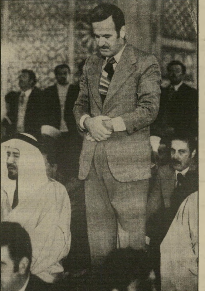
אל-אסד השמועות על המחלות אינן ברורות

תחת זאת התקדמו בככדות ותפסו חילה את השטח הפתוח שבין ריפולי ובין מחנות-הפליטים ממוחה. ככשו" את מחנה נהר-אל-ברד, רפנה בעוד מועד על-ידי כוחות פפאת, כדי למנוע את כיתורם. הם תחילו להילחם על מחנה אל-ברדאוי. הם כוחותיו העיקריים של ערפאת,