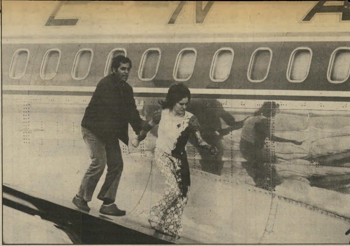
בדם. היא נפגעה מכדור מתחת לבית שחייה, הובהלה לבית-חולים, שם ניצלו חייה. תרו ברחה מבית-ספר לאחיות בנצרת. אחרי שאביה אסר עליה להינשא לאהובה המוסלמי. השניים עברו את הגבול ללבנון.