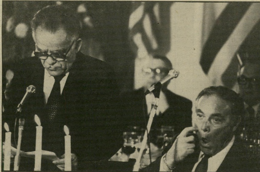
מוראייז הייג (ראשי-ממשלה שמיר) כיסוי אוהד וסיוע פוליטי