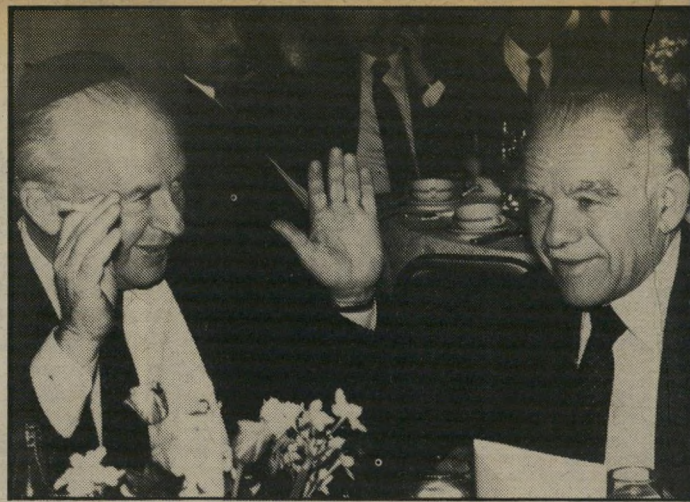
אחדות לאומית בין החוגגים היו שני היצחקים, משני המחנות: ראש-הממשלה, יצחק שמיר, ומי שהיה ראש-הממשלה, יצחק רבין, הקפידו, כמובן, לחבוש כיפות.