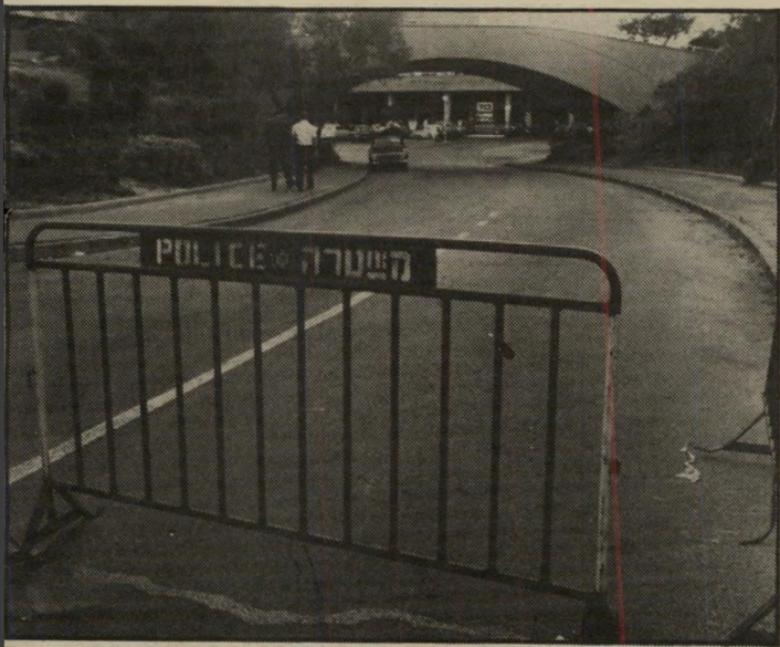
סגור ומסוגר משעות הבוקר המוקדמות נאסרה הכניסה והחנייה ברחובות הסמוכים למלון הילטון. דבר שגרם גם להפסקת העבודה בתחנת הדלק. בקירבת רחבת הכניסה

(המשך מעמוד 13) בחתונה, חוץ מאשר לעוברי-המדינה, את מיכסת המס מ-75 אחוז ל-95. כי זה ממש לא ייאמן איוה עושר רואים כאן" אמר חיים יבין, איש הטלוויזיה הישראלי.