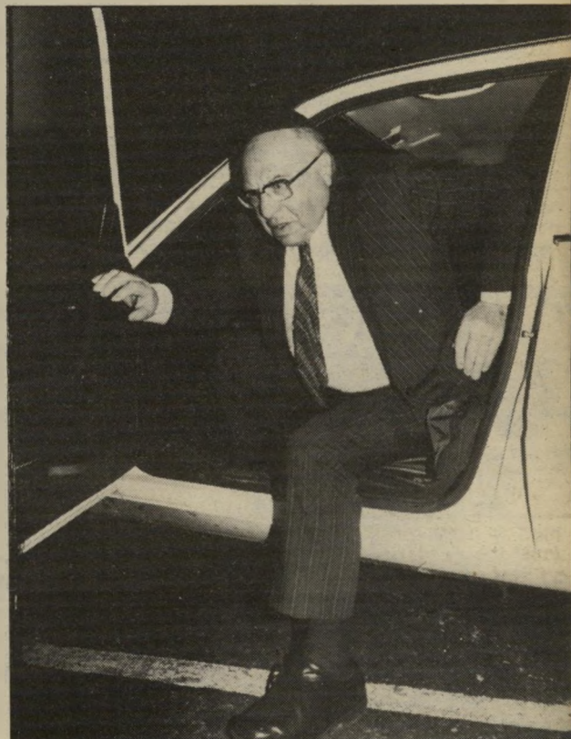
כורג הניצח לא בלט בין האדמורים שהומיעו בקמפוס תות עשויים מבד-ברוקאד. בתמונה למטה יאה הרמטכ"ל ממהר לסעודה. עשרות חיילים גויסו לשמירת האולם.