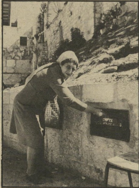
תרומים אלמוניים ליד הקוסמות באיזור הבותל וקברירחל פער של מאות אלפי שקלים

עד לשנת 1978 הריקו את הכסף עובדים מטעם מישרד הרתות ורק בנובמבר 1978 אחרי שהתחילו לחפש שחיתויות קשות במישרד הרתות, נערכה התקשרות עם חברת שמירה.