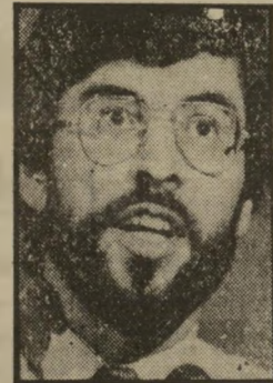
אירי אדאמס גרש בריטים

כמו בלבנון, יש לסיכסוך רקע כלכלי-מעמדי, וגם לאומי-דת. הקאטולים מהווים רוב מכריע באייר, הרפובליקה האירית.