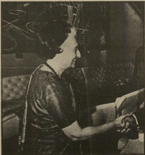
מארכת גאנדי הון פוליטי

המארכת, ראשי-ממשלת הודו אינדירה גאנדי, שרוייה, כרגיל,