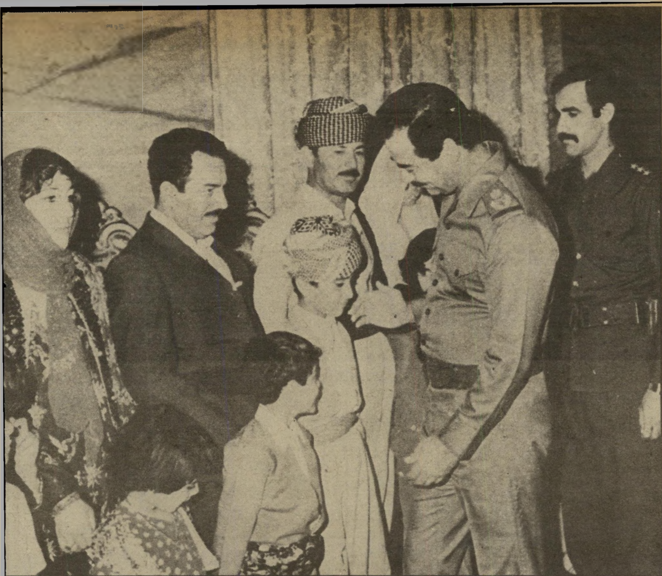
נשיא עיראק סאדם חוסיין ותורמים כורדיים המרד נדס, הסולידאריות גברה

זרובן בת 10. עוד כטרם שככו סערות אלה פרצה שערורייה חדשה. התברר כי הבניינים