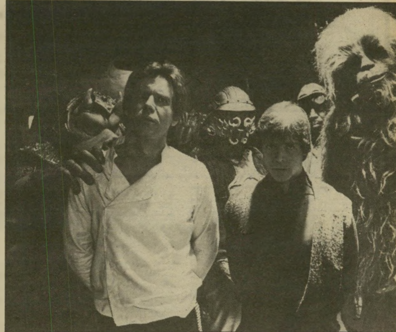
האריסון סורד, מארק האמיל וצ'יובאקה ב. מילחמת הכוכבים — מוטב לחיות בעולם של הטובים —

אחד מחבריו לספסל הלימודים (דרכיהם הצטלבו מאז לא פעם), התסריטאי-נימאי ג'ון מיליוס, טוען שהברנש השתקן והמופנם הזה היה הכוכב של הכיתה. הוא לא ראה את עצמו כפוף לשום חוק ולשום מוסכמה. הוא טען שיותר לעשות הכל ואפשר להשליך לפח את כל החוקים הישנים. חוץ מזה, הוא היה חסיד נלהב של הגל החדש הצרפתי, בתקופה שבה אנשי המיקצוע באמריקה, או אלה שרצו להיות אנשי מיקצוע, התביישו אפילו להורות שהם שמעו על התועבה