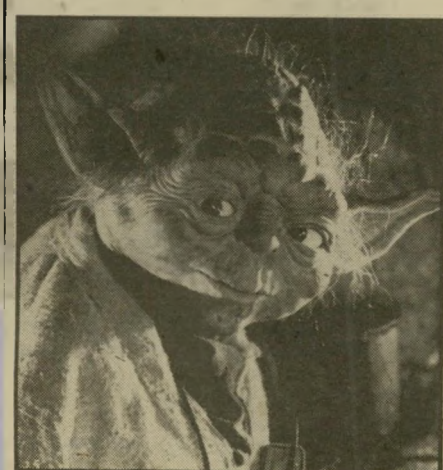
מיסלצת חכמה — יודה להציל מפשיטת רגל

תלמיד בינוני. נדמה כאילו ההשקפה הדתית הזאת, באה ללוקאס לארדווקא מתוך עיון בספר התנ"ך, אלא מקריאה מרוכזת ומאומצת של כל סיפרי הסדרות המצויירות שהתפרסמו באמריקה, ואחרי-כך במעקב אחר הנפשתם על