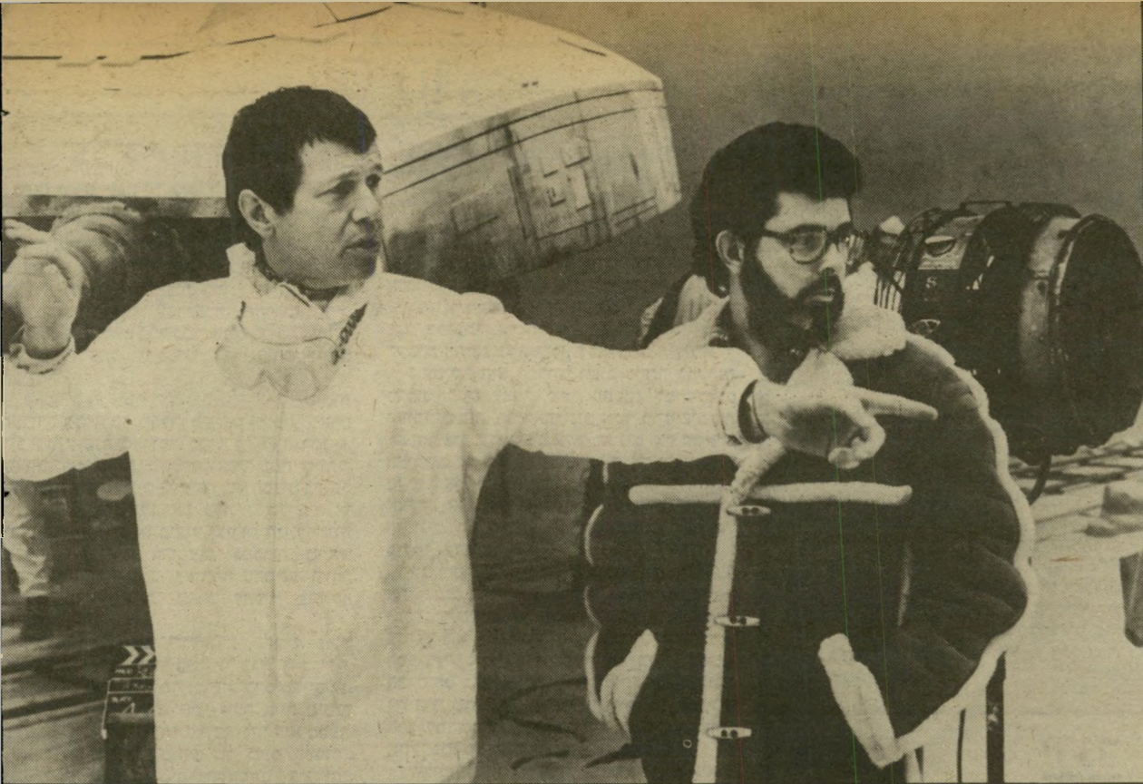
ג'ורג' לוקאס (מזוהה) עם הבימאי ריצ'ארד מארקנד בהסרטה. שובו של הג'ורג' יש אלוהים בשמיים

כיום, בגיל 39, הוא נמצא בתקופת מעבר הדרושת מנוחה, נשימה עמוקה וחשיבה מחודשת על העתיד. ראשית, הוא סיים את שלושת הפרקים במה שצריך להיות האפוס הגדול ביותר שהקדיש הקולנוע למרחבי היקום. שנית, התגרש מרעייתו מרשיה, שלה היה נשוי 15 שנים. אין זה מיקרה שהאיירועים נרשמו בסדר זה, כי אחת הסיבות לגט, לדברי בת זוגו, היתה רווקא העובדה שלוקאס התקשה לצאת מן העולם הפרטי והרימוני שהוא בנה לעצמו, ולנחות מפעם לפעם, גם אל המציאות של חיי הנישואין. כמו האחים גרים, כך מספרת האשה שהיתה למעשה שותפתו המלאה בכל התלאות המיקצועיות שלו, מתחילת רכבו. מארשיה היא עורכת-סרטים, לרעת רבים אחת העורכות הטובות ביותר בהוליווד (קרי בעולם כולו), ובתור שכזאת היא עברה כמעט על כל סרטי. אלא שהיא תבעה לעצמה את הזכות להינתק, מזמן לזמן, משולחן העריכה. לא פעם נוצר הרושם שבעלה לא הבין בריוק למה היא מתכוונת. אין זה אלא טבעי, לגבי האיש אשר רבים רואים בו את ההקבלה המודרנית למספרי