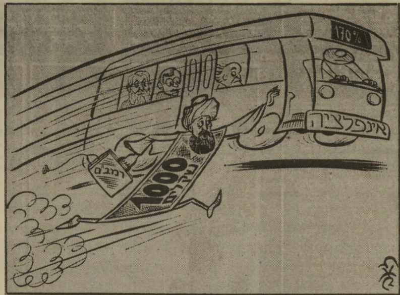
קריקטורה של זאב ב.הארץ' זה לא כסף

מיכתבי קוראים מתפרסמים בקצורים המתחייבים מתוכנם ומשיקולי מקום. עדיפות ניתנת למיכתבים קצרים, מודפסים במכונת-כתיבה, שצורפה אליהם תמונת הכותב. מיכתבים בעילום-שם לא יפורסמו. אין המערכת מחזירה את המיכתבים שנתקבלו בה.