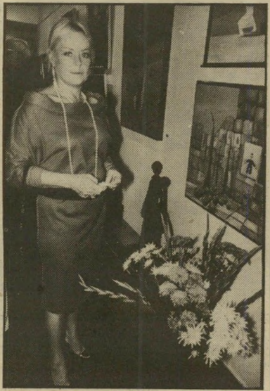
עדה מכנס להיות צעירה

כלי גבר. הוא מבלה לברו את שעות החופשה שלו מהצילומים. הוא מרכה לבקר בסאונה של המלון, כשהוא מסתובב עירום בין החברים של המועדון, כאחד העם. מה הוא עושה כשהוא לברו בחדר? לא תאמינו: הוא רוקס גובלנים! או מי שחי במלון, שלא יתפלא כשתפתח הרלת וגבר יבקש ממנו חוט צהוב. זהו, בינתיים. אני מקווה שבשבוע הבא אטפל בהם ביתר יסודיות.