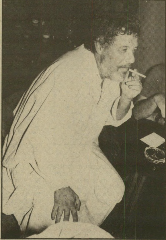
דן בך אמוץ מבוגרות יותר