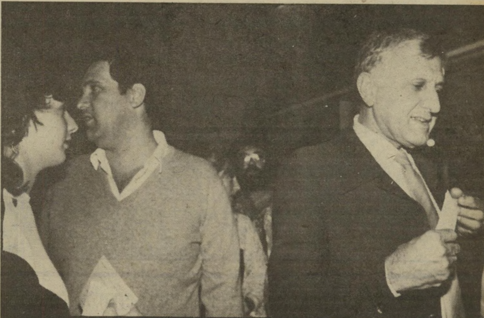
גבע, ניסה להתרחק מהבזקי המצלמות. אמרתי לבני, העולם שלי ושלך זהה, אבל איני מקבל את הדרך. אמר האב. היה עליך להמשיך ולשכנע. את מי?

דני הורביץ, הבימאי, שמע על התפטרות המח"ט כשהיה בטויל באירופה. כשחזר לישראל הוא ניסה את מזלו, התקשר לגבע, שהסכים להיפגש איתו. היו להם הרבה שיחות. גבע סיפר לו על עברו, על השתלשלות האירועים עד שהחליט להתפטר. גבע גם נכה בחזרות, שנערכו ברמת הכובש. לכן חבל כל-כך שבמחזה אין כמעט אינפורמציה חדשה, חבל שההצגה היא חסרת צבע ואפרורית, והיא מוכירה בהצגת תלמידי בית-ספר יסודי.