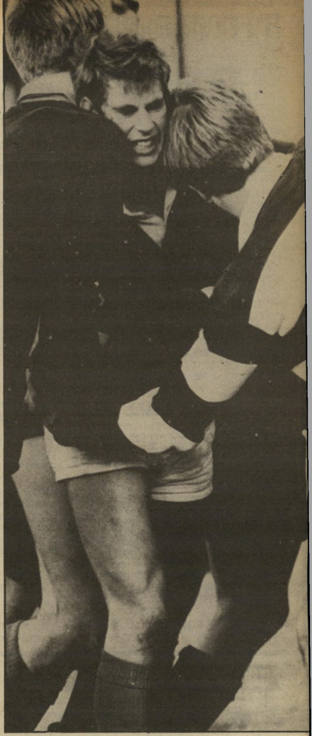
הנסיך אדוארד: הנסיך הקטן מרביץ מכוח

מזה כמה חודשים טובים עוקבת האומה האמריקאית בדאגה אחר גיורתה של הגברת הראשונה, שהצטמקה יתר על המידה, ואחר מצב בריאותה. שעל פי השמועות אינו מן המזהירים. היו גם כאלה שחשדו כי מאו ההתנקשות בנשיא רגן, רואגת רעייתו כליכך לשלום בעלה, עד שהרבר פוגע במצבה שלה. בשל דאגה זו אולי גם תפעל כדי למנוע את מועמדותו המחודשת למישרת נשיא. בבחירות הבאות. כרי להרגיע את הדואגים, קמה נאנסי השכם בכוקר, בשעה