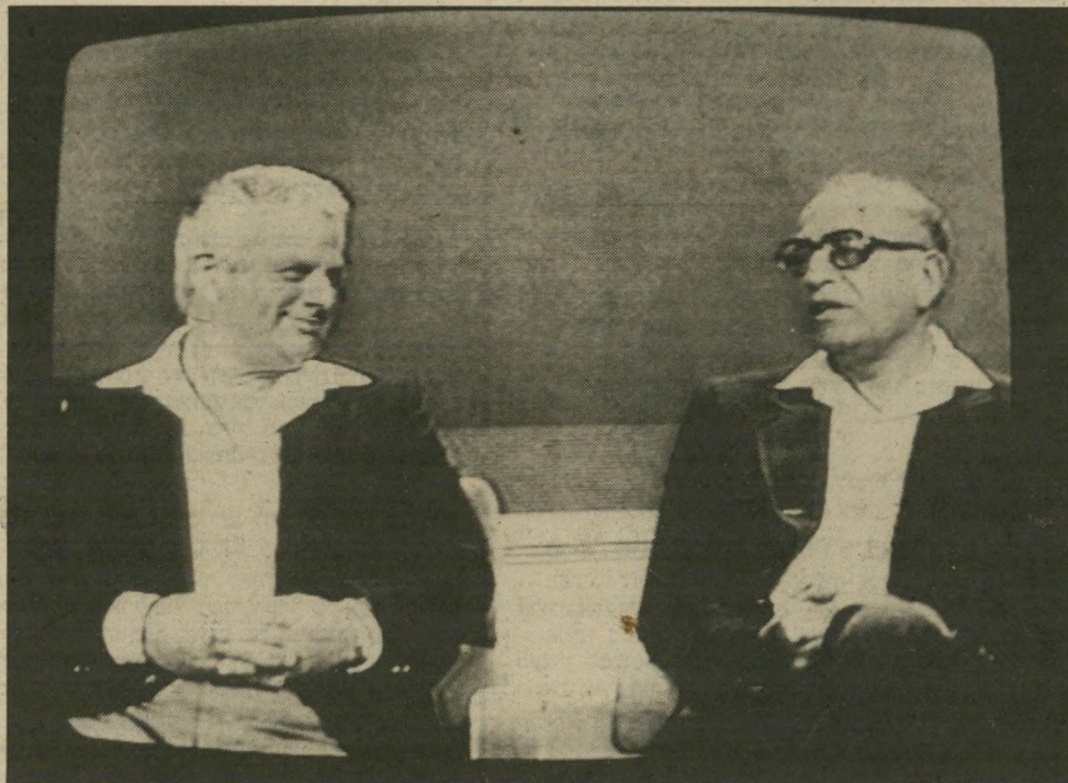
בְּפִרְוֹת עִם תֵּגֵר בְּרֵאיוֹן „שַׁעֵה טוֹבָה” אַחַד לְמֵאֲסֵר-עוֹלָם. הַשְּׁנִי שׁוֹחֵר מֵיִד. מְדוּעַ?

לזכור חללו יהודי עיראק לראות בווייתור על נתינותם עניין בווער. השוטרים ופקידי הרישום נשארו ללא עבודה. לפתע התפוצצה פצצה שניה. הפעם