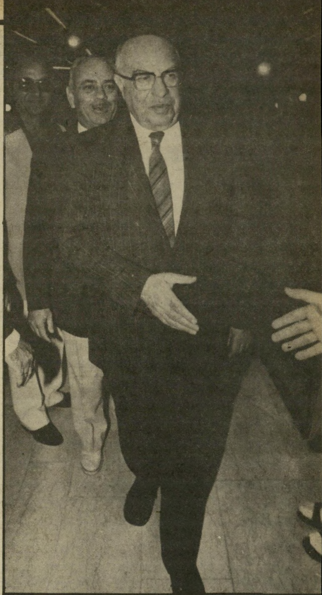
שריהפנים בורג ידו של מי?

הטענות שהם מעלים כנגד המפכ"ל הן גם במישור האישי וגם במישור המיקצועי. טוענים נגרו שאינו תקיף, שהוא חלש ונתון להשפעת הדרג הפוליטי, שהוא נמנע מקבלת החלטות הקשורות לטיפול שוטף והחלטות הקשורות בעתיד המישטרה, שהוא מעכב מינויים שלא לצורך, מבריח את המוחות הטובים שעוד נשארו במישטרה, ושכתוצאה מכך הוא יוצר רמורליזציה גדולה בקרב רבבת לובשי המדים. היריבים גורסים, שדעתם לגבי תפקודו הלקוי של המפכ"ל, מתחזקת אחרי כל ישיבת ספ"ב — סגל הפיקוד הבכיר של המישטרה, גוף הזהה