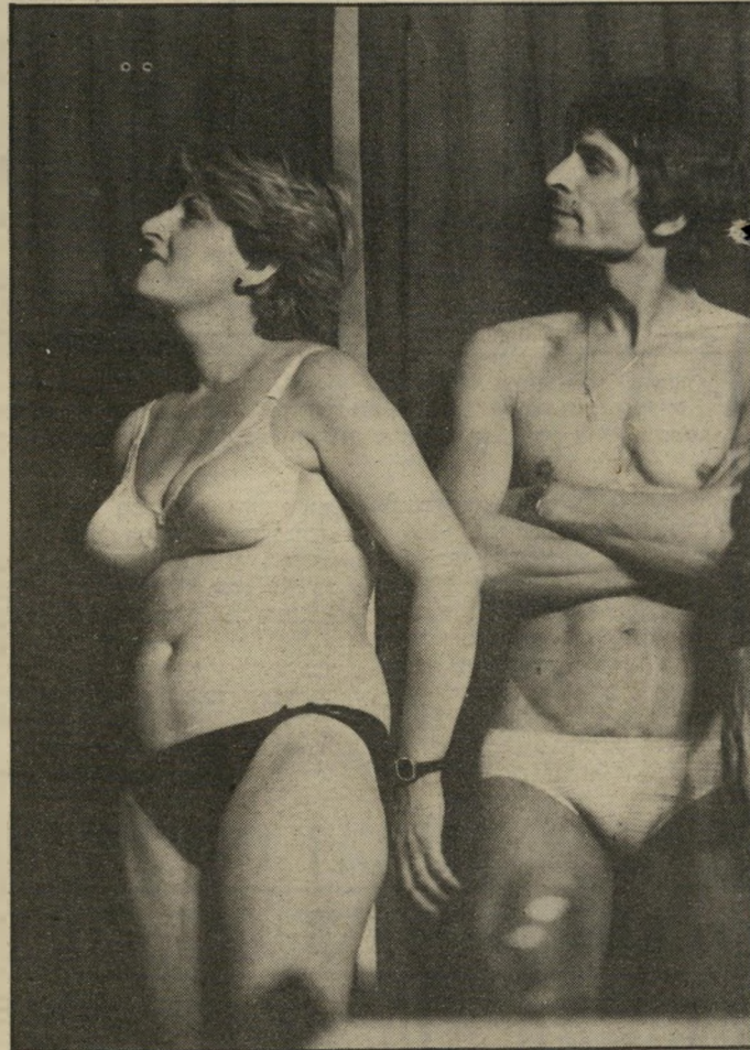
שלב ראשון זוג עקשן שהפתיע את הקהל היה הזוג שבי-תמונה, שהגיע למופע כשהוא לבוש בכמה שכבות והיה משוכנע שיזכה במסר מבלי לחשוף אחוריים ושדיים.