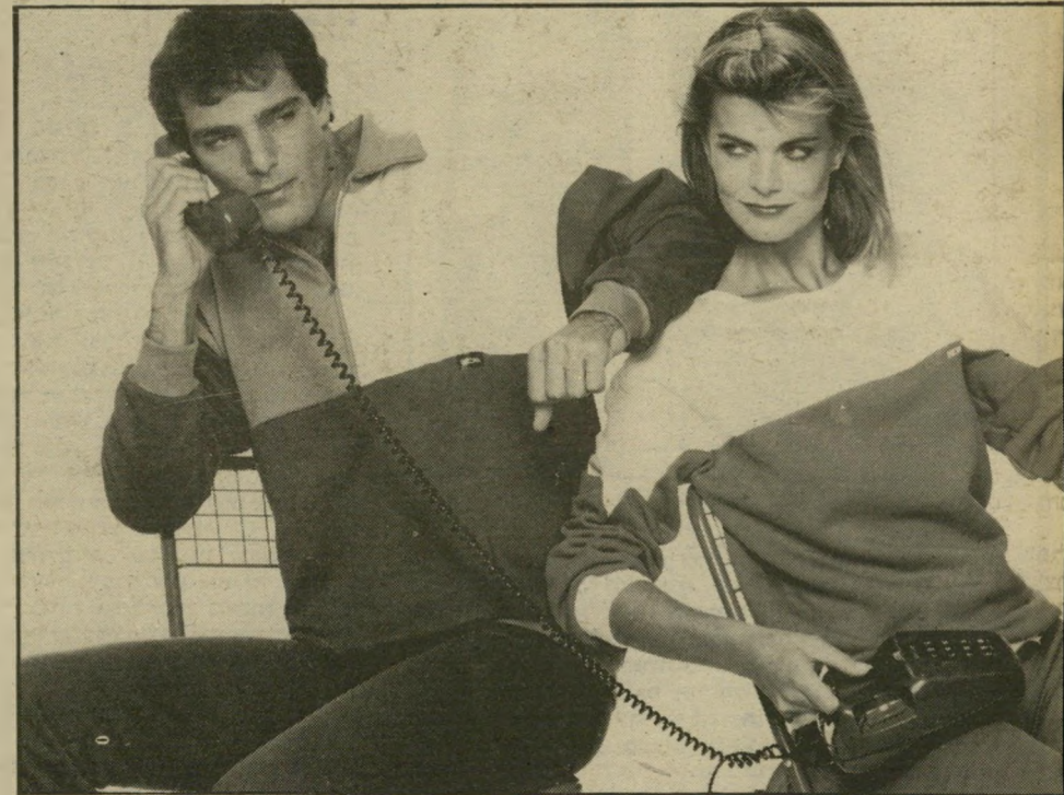
יאומטרי זהו סטייל אימונית החורף של חום ומואה. הבד הוא מאה אחוז תנה מוטר מגורד, הניתן לרחה ביד ללא צורך. העיצוב הוא צרפתי והתפירה היא ישראלית.