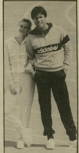
לו ולה טריינינג יוני-סקס צב"י של אדידס. צב"י עם כמכנס של אדידס-לבן ולבן.

חולצת-סוודר בסיגנון הספארי, בצבעי אפור-שחור, המודגשת בהרפס באותיות קידוש לבנה, כיסים חיצוניים, אבזמים ורוכסן. מחירה: 1800 שקל. חולצת-סוודר זאת מתאימה כמעט לכל זוג מיכנסיים ספורטיביים הנמצא בארון. לאותם החושבים את עצמם קצת יותר ספורטיביים, או הרוצים להיראות כאלה, עיצב רוברט חליפת טריינינג לבנה, המורכבת מחולצה ומיכנסיים קצרים בצבע כחול. זוהי חליפה לגבר הקונה אחת ורוצה להרגיש שקיבל שתיים בתמורה. מחירה: 4600 שקל.