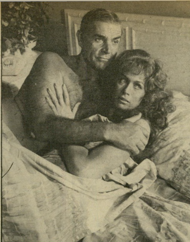
שוון קונרי עם ידידה למני כל שיכלולי הטכניקה וכל ההמצאות החדשניות יש צורך באדם שידע להפעיל אותם*