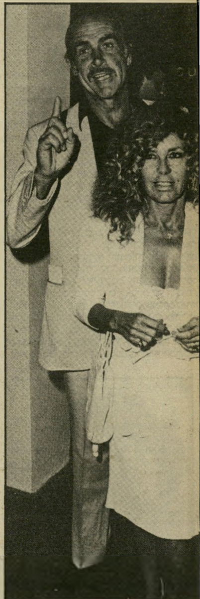
שוון קונרי עם אשתו היא שיכנעה אותי

שהגיבור הזה הוא כמעט אנושי בחולשותיו, מאפיינת את הגישה של הכוכב, שוון קונרי. שנאות לשוכ לתפקיד 007 אחרי תריסר שנים. לפני שחתם על החוזה עם המפיק ג'ק שווארצמן, הבחיר שהתנאי הראשון שלו זה להתעסק אם דמות של אדם, בשרודם, ולא קארטיקטורה מקרטון. הסרט נפתח בדיוקנו של בונד, כאדם ולא כגיבור, משום שלפני כל שכלולי הטכניקה וכל ההמצאות החדשניות, יש צורך באדם, שניחן בכל החושים הדרושים כדי להפעיל אותם, ובשיקול-הדעת כדי להחליט מתי לעשות זאת. אחרת, אין תיקוה למין האנושי, נאום קונרי-בונד.