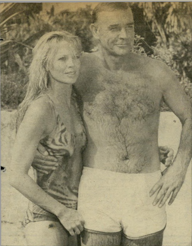
שוון קונרי עם חברה* למני כל שיכלולי הטכניקה וכל ההמצאות החדשניות יש צורך באדם שידע להפעיל אותם*