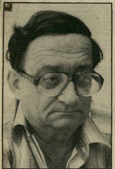
איש-טבע אלון מחיות עד ציפורים

נפט ♦ בתל-אביב, בגיל 84, ישראל זמורה , סופר ומזל, שנודע במיוחד בהוצאת הספרים שלו, מחברות לספרות, שבה פרסם תרגומי מופת, מעשה עטו, מאנגלית, צרפתית, רוסית וגרמנית ואשר רבבות תלמידי בתי-ספר וזכרים את כרכי היצירות הקלאסיות של הוצאתו, מהכוזבי עזי שירי יהודה הלוי, זמורה, סנדק המשוררים, היה המזל הראשון של נתן אלתרמן, יונתן רטוש, אהרון אמיר ואחרים. הוא פרסם בעצמו שירים (הראשון בגיל 14), הירבה לכתוב ביקורת ספרותית תחת שמות-עט שונים שתמיד