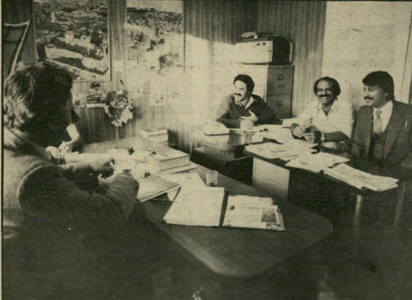
קראעין בישיבת מערכת של אלי-עזרה ילדים ברחוב כתשו ברגליהם כששמעו את שמו של אסד