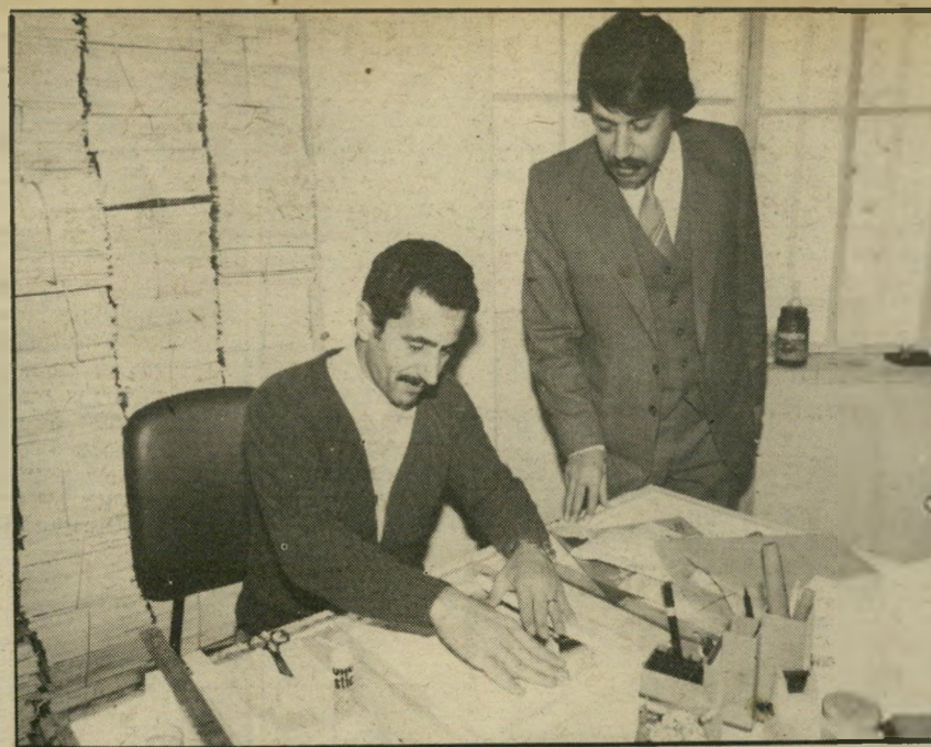
קראעין ליד שולחן העריכה חסר לנו חצי מיליון דולר!