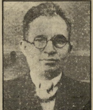
רוצח מיזואן הודאה בבית-חולים לחולי-נפש

בפסח 1982 יצאה ילדה בת 5 מביתה כפתח-חיקוניה לקיוסק, מהלך חמש דקות מביתה. היתה זו שעת צהריים והחור היה רב. הילדה הלכה לקנות גלידה. כאשר היתה הילדה