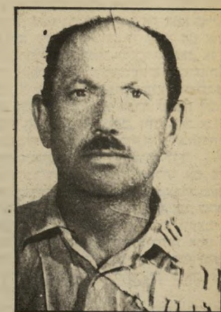
רוצח לייבוביץ מעידה במדרגות

נסיון לאונס נוסף של ילדה אירע ב-18 באוקטובר השנה, בהרצליה. לדה בת 12 יצאה כצהריים כשבת לטייל ברחוב עם כלבה. גבר צנום התנפל עליה, משך אותה לחצר, הפיל אותה ארצה והכריח אותה להוריד את בגדיה. הוא ניסה לאונסה, אך לא הצליח ועזב את הילדה הממררת בככי. אחרי יומיים, ב-20 באוקטובר, נמדה אשה צעירה בתא טלפון ציבורי ברמת-גן, ליד הבורסה, ושוחחה לטלפון. ביה החוקה רצועה שאליה