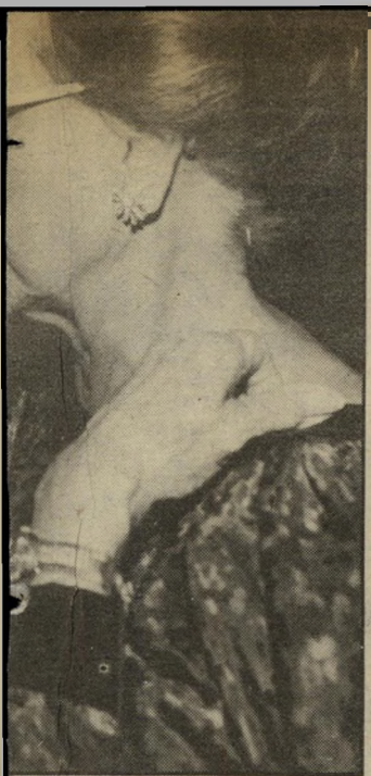
אביד הכבוד האביד ש מוריס ב העניק בנין את תואר האבידות לחמי