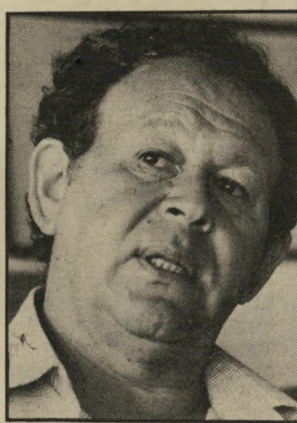
גור: לא שמע