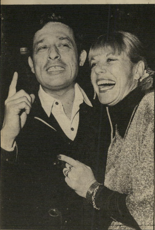
מר גלית: שדולה להחמרת העונשים