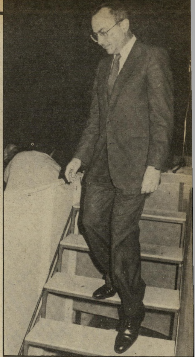
ארנס: מאחורי פני הכפוקר, פנים אחרות

בשיחתו עם העולם הזה" היה ישראל גלילי זהיר, כדרכו. הוא הדגיש את התנגדותו לסרבנות, אך סירב לומר שהוא מתנגד דווקא לסירוב לשרת בלבנון, או בגדה המערבית. אני מתנגד לסרבנות במובנה הכללי, התעקש גלילי. גלילי דיבר אומנם ברצון ובאדיבות, אך משנתבקש לפרט את דעותיו, נזכר שוב בתקופת המחלוקת, ואמר שדברים מטורטים הם לא לטלפון.