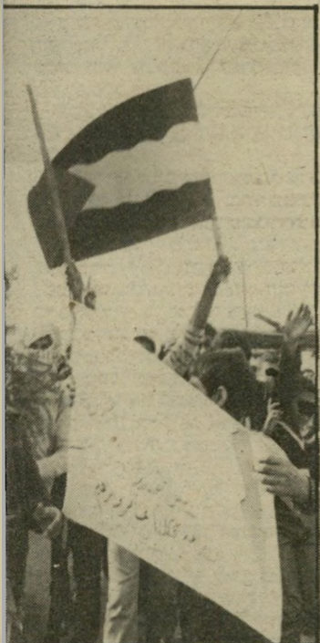
דגל דגל מלסטין בצבעי אדום-שחור-ירוק-לבן, שהונף בעת תהלוכת האבל בטולכרם.

של הצבאי כגרה, נתנה השבוע את אותותיה. הגדה המערבית כוערת. היריעות