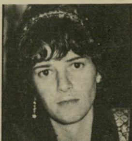
כתבת-צלמת סרגוסטי להסית את הערבים...

של הצבאי כגרה, נתנה השבוע את אותותיה. הגדה המערבית כוערת. היריעות