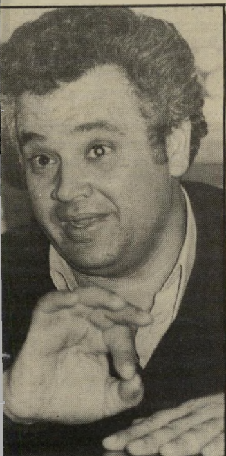
קבלן גניש גירשתי אותו

בתחילת חודש אוגוסט ניצל מוניה שפירא בנס, כאשר מכוניתו שמולכדה לא התפוצצה. שטרומן נעצר מיד אך הוא שוחרר אחרי פחות מ-8 שעות. מישרדי החברה נסגרו, והם היום שוממים.