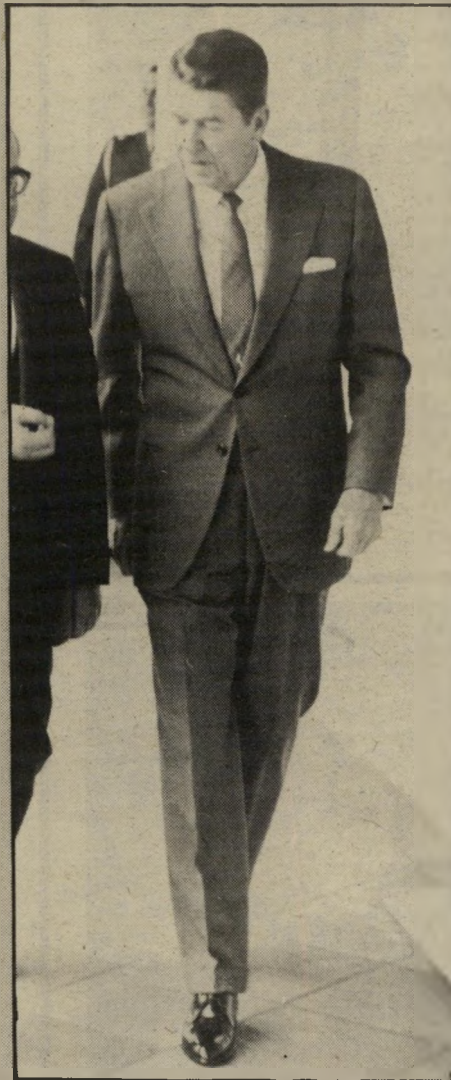
רגן הכשרת הקרקע

בכל רחבי העולם ראו קוראיה עיתונים וצופי הטלוויזיה את התמונות האלה. הכובשים האמריקאים עושים באי הקאריבי הטון כבתוך שלהם, עוצרים את תושבי המקום, רוצחים קובאים הנמצאים שם באורח חוקי, לפי הומנת ממשלת מדינת ביישופ המנות. ארצות הברית טוענת, שהיא באה לחסל את הקושרים נגד ביישופ. היא משכיחה את העובדה, שבישופ עצמו היה מארכסיסט, אנטי אמריקאי מובהק, ששינה לחלוטין את היבנה החברתי בארצו, וקשר קשרים הדוקים ביותר עם נשיא קובה, פידל קאסטרו. האמריקאים ארבו דווקא