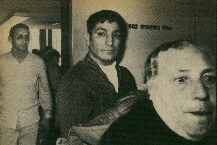
שופט משהראוי (שמאל) בבית-המישפט המישרה תפרה לי חליפה –

להלשין על חבריו. אבל אני הייתי כזה, אלא פעלתי כאי-המסייע למישרה במילחמה בפשע. יותר נכון לקרוא סיעון מישרתי. המילה מל פגעה בי קשות.