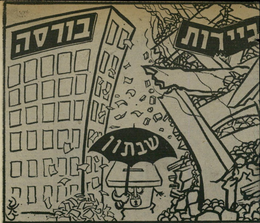
קריקטורה של זאב ב"האריץ" חיסכון של 119 משכורות

וסחטות מסיעות הרוב ויתורים בענייני הדרת. לכן שמחו כה רבים מתושבי תל-אביב כששמעו, ששתי הסיעות הגדולות, הליכוד והמערך, מנהלות משאומתן להקמת קואליציה, שתהיה משוחררת מלחצי החזית-הדתית. שימחה זו היתה רק נחלתם של אותם שלא עקבו בקפדנות אחרי מערכת הבחירות העירונית