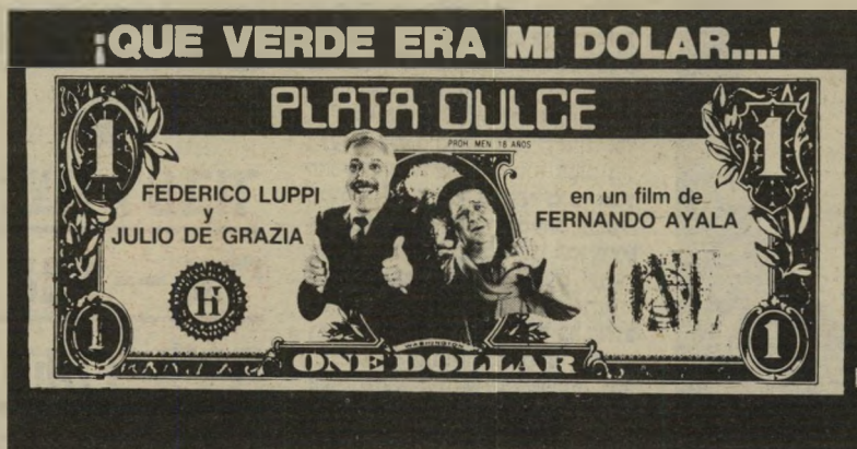
כמה ירוק היה הדולר שלי" — גלויית פירסומת לכסף קל, טרמפ על ענן מוזהב

מהרה מוזמן הצבא להשליט סדר במקום. כשלב ראשון, הצבא, הנצמד ברקיקנות לאות הכתובה של החוק, מבטיח את זכויות השוכנים הרורשים תנאי חיים טובים יותר. בשלב שני, כאשר נמצאת הטענה המתאימה, הופך הקולונל שהיה קודם לכן אביר הצדק, למשמד חסר-רחמים של מי שהוגדר בעיניו מייד כ"אויב". "אני מעדיף לחסל מאה מהם ולא לסכן חמישה מחיילי", הוא מכריז בגאון. ועוד: "מאחר שאין שום ררך לשמור על שבויים, צריך להרוג אותם." והלאה: "אכזריות עדיפה על הפרת פקודה." האם אין צליל מוכר לכל ההערות הללו? סופו של דבר, הצבא כמובן מנצח, ואז באים בעלי האחוות והמיפעלים, ומציעים לקולונל להיות המושל של המדינה, כי רק הוא יודע לשמור על סדר בה. כאמור, זה קורה לא רק באטאגוניה.