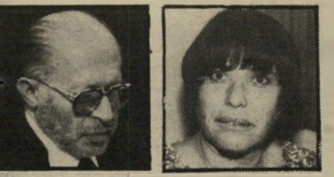
אלכסנדר אווירה עצובה בגין

והיסטוריונים מיקצועיים - מאמרו של אבנרי מציג את הניתוח המבריק ביותר ואת הסיכום הטוב ביותר של הנושא. על מורכבותו. השאלות מנוסחות באופן נכון - דבר חשוב אך נדיר ביותר, לכל הדיעות - והתשובות עליהן הן נכונות. המאמר גם מסביר ניגודים שונים רבים, הטמונים בעצם מהותה של תקופת שילטונו של מנחם בגין. בנוסף לצד האינטלקטואלי המצוי, המאמר גם מצטיין בטון הריגשי המתאים, ובאווירה