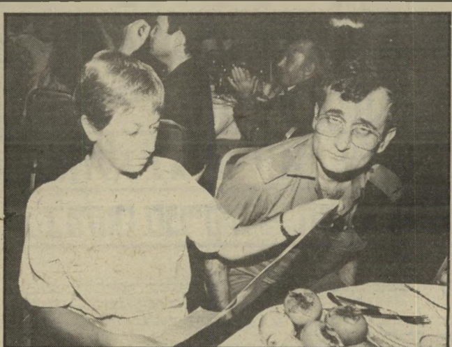
תעודת כבוד תת-אלוף ד"ר משה רווח, קצין רפואה ראשי לידו אשתו, הקוראת את תעודת-הכבוד שהוענקה לבעלה. למטה: הרמטכ"ל משה לוי ומארגנת הערב נעמי שדמי.