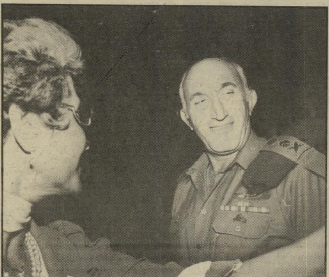
כך שנשארו הרמטכ"ל כאורח הבכיר במקום. הוא התבקש לעבור בי שולחנות הפצועים ולהחליף איתו מילים. הוא ניגש לשני שולחנות ואחרי זה אמר: "אולי נרחה את זה. אבל מארגני הערב לא ויתרו לו. הן אמרו לו: "בסדר, אחרי הארוחה תמשיך."