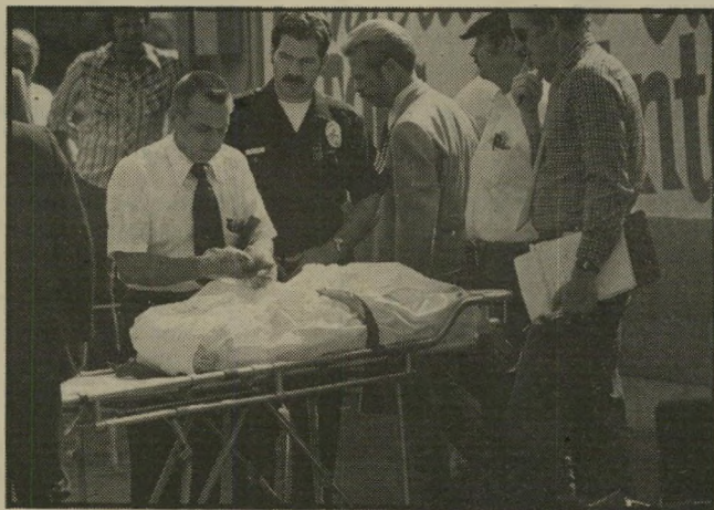
חוקרי מישטרת לוס אנג'לס עם חלקי הגופות השרידים הוכנסו לשקיות ניילון

מא פרשת הרצח המועזע במלון בונה וונטו ירדה המאפיה הישראלית בלוס אנג'לס מהחדשות, אך ידיה הארוכות עדיין מפחידות את אלי קומארצ'רו, שנאלץ לאמץ לו זהות לא לזכר להסתתר מפניה.