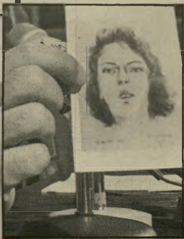
תמונת הנרצחת ראובן פגישה עיסקית רגילה