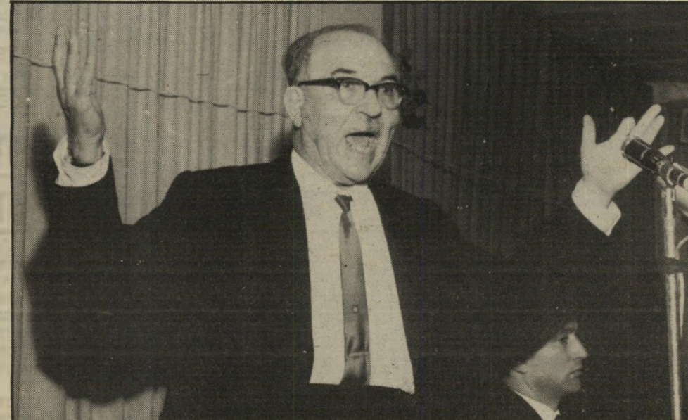
האיש שהתפתח רוגשי-הונומטלה בשנות ה'60 היה לוי אשכול. עד להחלטה על המיתון דגל אשכול במדיניות של הרחבה ופיתוח מואץ. בבית שבמושבה הגרמנית בירושלים נפלה ההחלטה על המיתון, שהוליד למילחמה. ששברה את המיתון.

הקוראים של העיתונים בכותרות ההולכות ונרחקות אל שולי העמוד הראשון ואל עמודי-הכלכלה המררי חקים, שבנק ישראל מזרים מדי יום עשרות מיליון דולר לבורסה, כדי להציל את מניות הבנקים מהתי מוטטות. בנק ישראל — על-פי הוראתו המפורשת של כהן אורגד, המקצץ — הזרים לבורסה תוך שבוע ימים יותר מ-330 מיליון דולר, שערכם השקילי מתקרב במהירות ל-30 מיליארד שקל. בלומר: מצד אחד מקצין שרי האוצר המישה מיליארד שקלים בתקציב החינוך — קיצוץ שהוא חסר משמעות כמעט, מפני שהוא יופרש על פני שנה — ומצד שני הוא משקיע בתוך שבוע ימים סכום הגדול מזה פי המישה ויותר בהצלת מניות הבנקים. ולכך הוא קורא מדיניות מרסנת. שרי האוצר החדש הוא חברו לסיעה של שרי-הביטחון, משה ארנס. כל עוד לא יצבור כהן אורגד עוצמה משלו בתנועת החרות, הוא לא יעז להתרועע בארנס, ולהציע קיצוץ בתקציב-