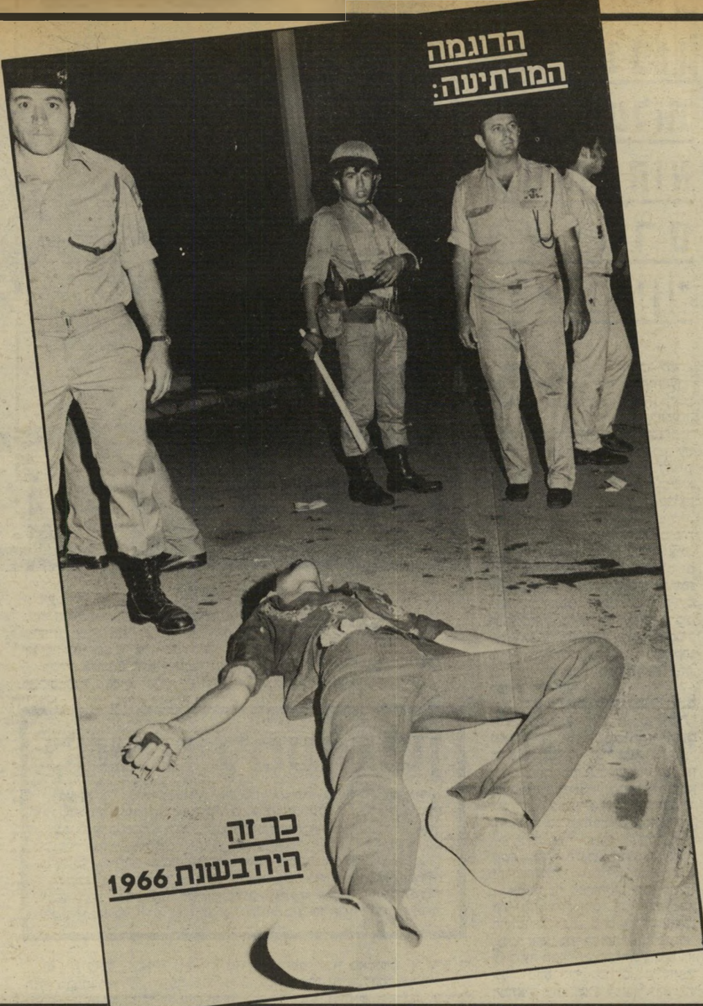
כך זה היה בשנת 1966

הביטחון. תקציב זה, על שלוחותיו השונות, בולע כשליש מהת"ג. שהיית צה"ל בלבנון לבדה בולעת מיליון דולר ביום — זאת על פי מקורות רישמיים. קרוב לנוראי שהסכום האמיתי גודל מזה בהרבה. על-פי חשבון ממעיט, בולעת שהיית צה"ל בלבנון 30 מיליון דולר בחודש. אך כאשר זקוק בית-החרושת אתא. המעסיק ארבעת אלפים עובדים, לתמיכה בסך כמה מיליון דולר — נזכר משרד האוצר הישראלי בתפי קירו כמקצץ הגדול. אפשר להמשיך בדוגמות מסוג זה עוד כהנה וכהנה. אפשר להזכיר את הסוכסידיות למזון, את תקציב ההתנחלויות, את ההקצבות לאגודת