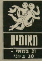
21 במאי - 20 ביוני

השבוע יפלו עליכם עומס עבודה ואחריות. במקום העבודה תתקשו למצוא לעצמכם זמן למנוחה. יתכן שכעת הזמן לחשוב על שינוי. מבחינה בריאו"תית אינכם חשים כר"גול. מעט דיכאון וחול"שה פיסית מקשים עלי"כם לתפקד כהלכה. רצוי להדבוק ביציאות מהבית ולהיג את הדיכאון והחרדות ב"חברה עליזה. בבית דברים עלולים להתקלקל, אינסטלציה או ביזרים חשמליים, מנו בזמן למומחים.