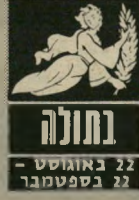
22 באוגוסט - 22 בספטמבר

בימים אלה אתם חושבים על שינוי מקום המגורים, או לפחות שינוי זמני. אולם ברגע זה תתקלו בקשיים לא מעטים לממש את רצונותיכם. הכרויות חדשות עשויות להביא אתכם למצב-רוח אופ"טימי ונלהב. מיכתב שתקבלו מחוץ-לארץ יבשר על בואו של ידיד או קרוב-משפחה לבי"קור, אל דאגה, למרות העבודה הביקור יוסיף לכם הנאה רבה. בשטח הרומנטי לא טוב להציע נישואין וליצור קשרים מחייבים.