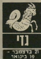
21 בדצמבר - 19 בינואר

קשיים ובעיות עם ידידים עלולים להביא אתכם למצב-רוח כבד וממורמר. רצוי שתבדקו היטב אם פרשתם נכון את דב"י ריחים או כוונותיהם, אתם נוטים להיות חשדניים מדי בתקופה זו. בני מזל סרטן עשויים לבוא לעזרתכם, ולרכך את מצב רוחכם. בשטח הרומנטי אתם עומדים לפגוש באדם שיהיה משמעותי מאוד בתקופה הקרובה. רצוי להרבות ביציאות מהבית. בימים האלה תפגשו בידידים ישנים.