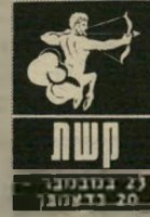
21 בנובמבר - 20 בדצמבר

אתם חשים את עצמכם לחוצים ונוטים להחליט דברים בצורה מהירה. אינכם שקטים ונתקלים במכ"שולים שאינכם מבינים מהיכן הם צצים. אתם נוטים ללכת לקיצוניות וזה עלול להביא לכם הפסדים. הימנעו מלב"קש השבוע הלוואות, ובכלל, קחו על עצמכם מה שפחות סיכונים. בעוד זמן מה המצב ייראה שונה, ואז תוכלו להרשות לעצמכם התנהגות שונה. מילכת מחוץ-לארץ עומד להגיע בימים אלה.