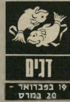
19 בפברואר - 20 במרץ

הימנעו מלהיגרר אחרי הצעות מפתות. כל מיני עסקות מפקפקות או היסחות שאין מאחריהן ביטוי. השבוע אתם נוטים להיות אופטימיים מדי. סטו"נטים ותלמידי בית"ספר יוכלו להצליח השבוע בלימודים או בבחינות. נסיעה לחוץ"לארץ עומדת להפרק, שימו לב עם מי הח"לטתם לבצע נסיעה זו ובידיקו פעם נוספת אם אפשר לתת אמון. בשטח הרומנטי עדיין צפויות הפתעות נעימות ומקרים משעשעים.