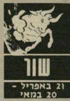
21 באפריל - 20 במאי

את אי-ההבנות שהיו לאחרונה עם אנשים בסביבתכם, תוכלו לפתור בעזרת שיחות למרות שדרך זו אינה מקובלת עליכם בדרך"כלל. אנשים מבוגרים יגרמו לכם אי-נעימות, יהיה עליכם לוותר להם הפעם, חבל להתעקש, יתברר שאי-אפשר לש"נות את המצב. נסיעה קצרה עשויה לשפר את מצב-הרוח וגם להגיש אתכם עם אדם מעניין ורציני למרות שרבים מכם מודאגים בגלל עניינים כספיים. יתברר שהשד אינו נורא.