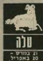
21 במרץ - 20 באפריל

מצב-הרוח אינו מן הטובים ביותר בימים אלה. אתם מרגישים את עצמכם בלתי-מרוצים וחסרי-מונחה. התרגשה הכל-לית גם היא אינה טובה ביותר. רצוי לגשת לרופא ולעבור בדיקה כללית. סכסוכים וחיכוכים עם בני-משפחה עלולים להקשות עליכם השבוע, נושא אי-ההבנה קשור בכספים, רצוי להמתין כחודש לפני שאתם מחליטים החלטה חשובה. בשטח הרומנטי היחסים מעט יגעים.