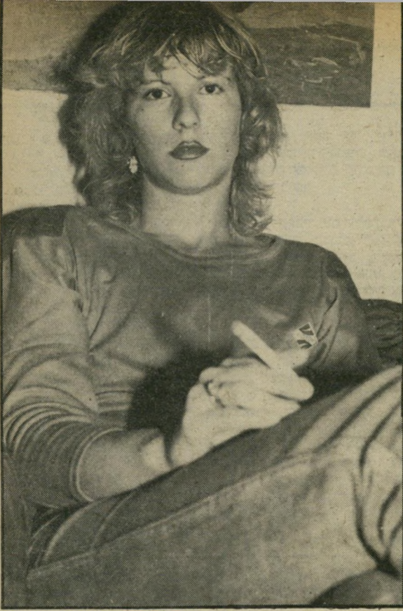
אחות שרית הילל לרדת על הבריכיים?

לעבור את התקופה הקשה עוד שישתחרר? לבעלי יש שיר מקסימלי, נערה לחורף. אני עבר שם חורף מאוד קשה וזה שיר שהוא מאוד אוהב. לא השמיעו אותו אפילו פעם אחת. אני לא רוצה שיבינו אותי לא נכון. אני לא מנסה לתפוס טרמפ על העניין. בעלי אפילו לא יודע מכל הסיפור, וכשיודע הוא יעסע מאוד. אילו רציתי לתפוס טרמפ על זה, יכולתי להתחיל במסע פירסום לעניין כבר לפני שנה ולא עשיתי זאת. אני בסך הכל מעבירה בקשה של אחי השבוי. זו בקשה צנועה ואני לא מבינה למה אי-אפשר להיענות לה. אני גם רוצה להדגיש שאין לי שום תלונה על צורת הטיפול במישפחות השבויים. להיפך, היחס אלינו נהדר, ואני מבינה שגם היחס אליהם בשבי טוב. אני לא יודעת מה אני צריכה לעשות. להתחנן ולרדת על בידר כיים. כדי שימלאו את הבקשה? אני יודעת שהשירים של בעלי משום מה אינם מושמעים כמעט ברדיו, גם כשהוא מקליט שירים חדשים. אולי למישהו יש אנטי כלפיו אבל אינני יודעת מדוע. או לפחות בתקופה עגומה זו, כשאחי כלוא בין ארבעה קירות, ואני יודעת שזה סיפוקו היחיד, כשהוא שומע קול שמעביר לו מסר מה בית, אני מבקשת שאותם אנשים יתרכבו ויחזרו זאת לתשומת ליבם. לכן זאת פנייתי לכל עורכי התוכניות, בבקשה למען אחי ולא יותר. מגליצה'ל נמסר כי הועברו אליהם במשך המילחמה שתי בקי שות אישיות ספציפיות להשמיע שיר מסויים. שתי הבקשות נענו. כלומר, השיר הושמע פעמיים. מאז לא ידוע להם על בקשה נוספת, והנושא פשוט ירד מן הפרק.