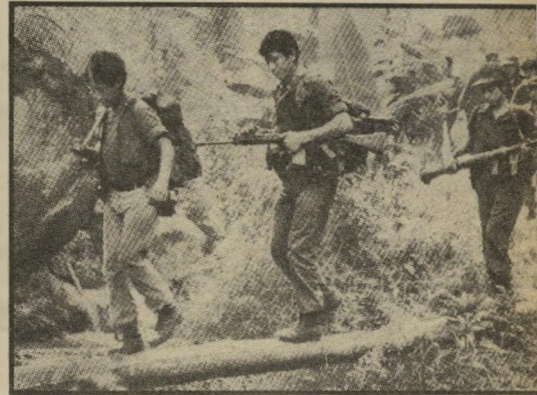
ה"קונטראס" בפעולה יועצים מארצות-הברית

הנוסחה הישנה, של סוכן אמריקאי אביר ומיטיב, הלוחם עד חורמה נגד הסאדיסטים המצדד השני, יצאה מהאופנה. אמריקאים