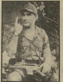
עריק זרו נשק מישראל

אנשי-רוח רבים בארצות-הברית היו מזועזעים מהתפ" קיד שמילאה סיאיי-אי בהשלטת דיקטטורה פא" שיטתית על צ'ילה. שיתוף-הפעולה בין הסוכנות החי שאית ובין חברות כלכליות אמריקאיות, הנהנות מכוח העבודה הוול במדינות המשווערות דיקטטורים צבאיים, השולטים בחסות אמריקאית, עורר פחד וסלידה. השילוב הזה נראה