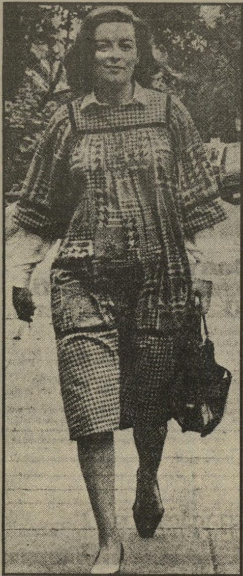
מזכירה קייס אסון, תעלול וכח

משקיפים אירופיים הביעו תמיהה על התגובה הזאת, האופיינית יותר לתחילת המאה. כמו רבים אחרים, הם התקשו להבין את אופייה של המפלגה השמרנית הבריטית, שתחת תאצ'ר היא מבקשת לחזור לתקופה הוויקטוריאנית. תאצ'ר מבינה היטב את נפש חסדיה, הבנויים מבחינה פוליטית ואנושית להתחסרות הקלאסית. שכל-כך איפיינה את תקופת הוורד הוויקטוריאנית, שהיא משאת-נפשם והנושא לנוסטאלגיה שלהם.