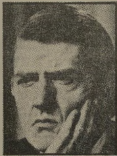
פארקינסון יהיר ומנופח