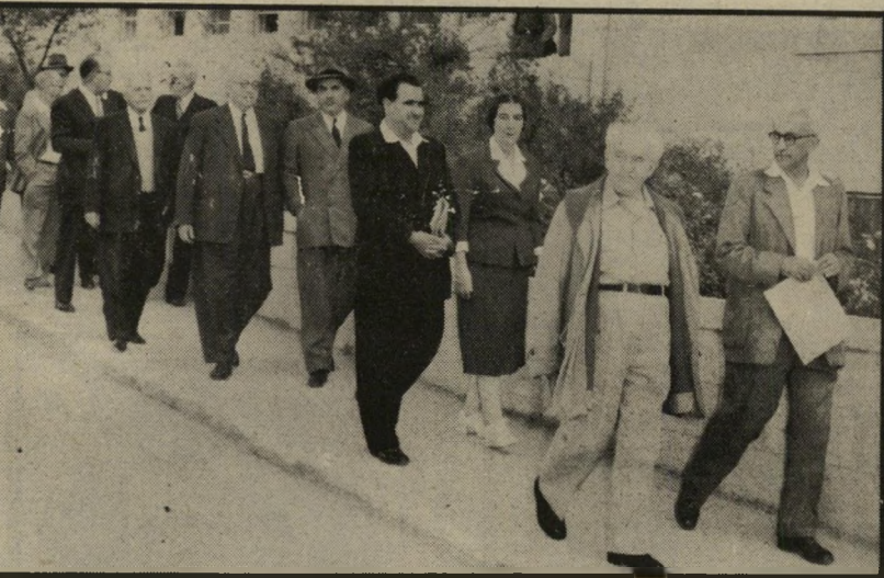
ממשלת בן-גוריון בדרך לבית-הנשיא • תמיד אשה

האוצר מרגישים בקיצוץ הסובסידיות. אפילו לשם מביאים מצרכים מסוגי-סדים, למרות שהדבר נשמע כמו להביא תבן לעופריים או פחם לקאסל.