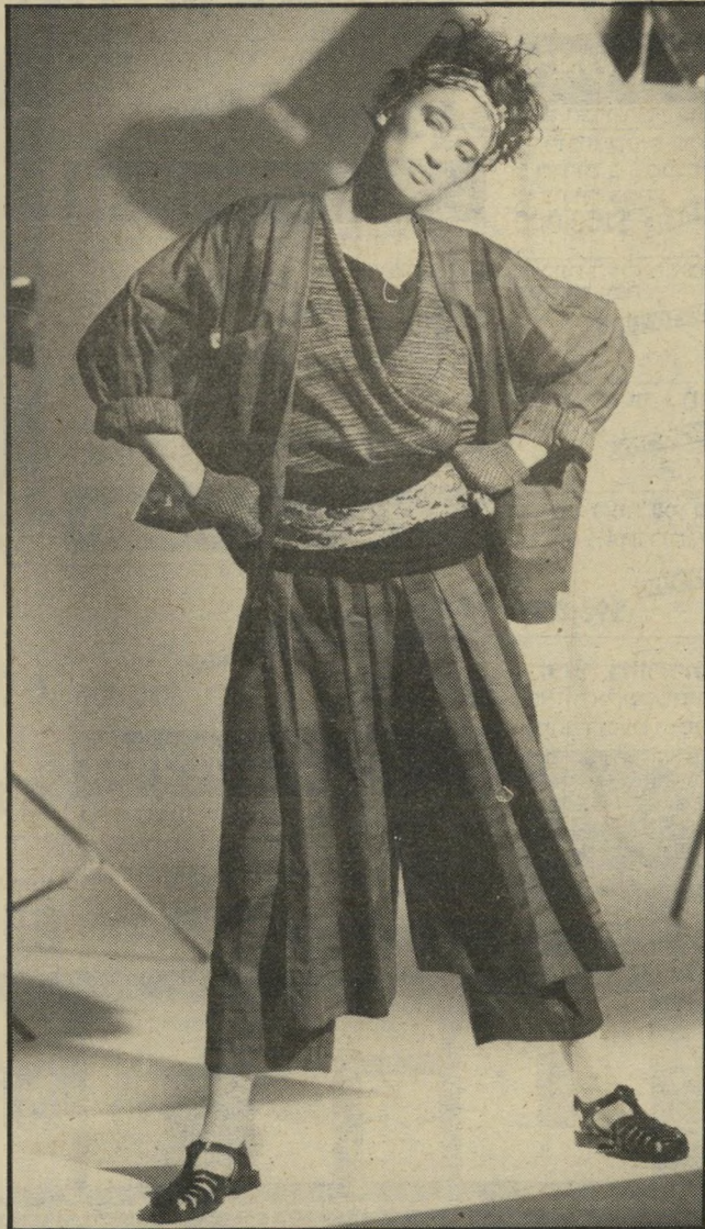
רחב זרוע הוא המראה של בית-האופנה אתנו הפריסאי. זהו מראה השכבות של הבצל, ז'אקט, חולצה, גופיה. מיכנסיים, סינר, שתי חגורות אחת על השניה ונעליים זרוקות.